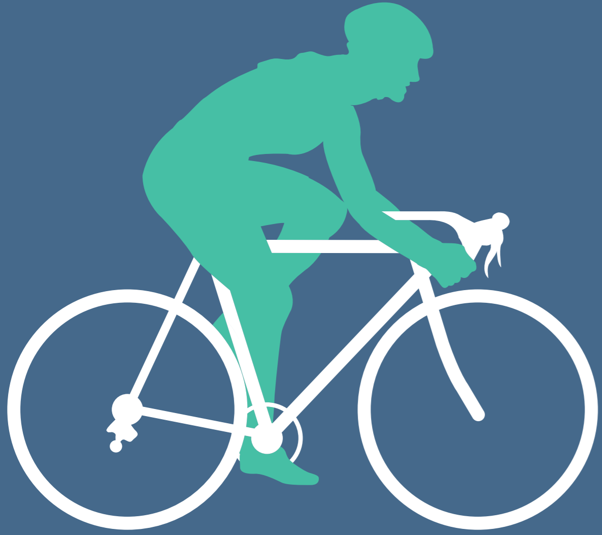
Gesundheit und Sport 20,0 %

Rechtsfähige Stiftungen des bürgerlichen Rechts, Mehrfachnennungen möglich, n= 20.133