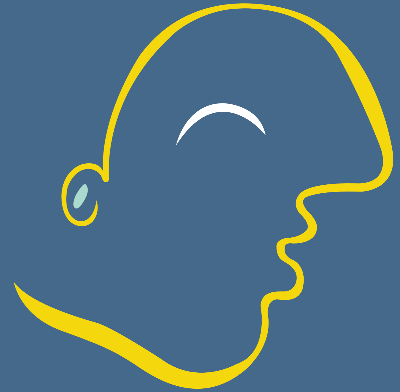
Kunst und Kultur 32,0 %