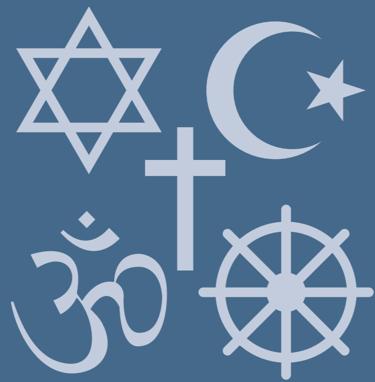
Religion und Kirche 11,5 %