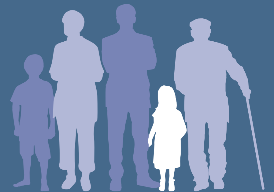
Private Zwecke 6,6 %

1. Oktober · #TagderStiftungen · www.tag-der-stiftungen.de