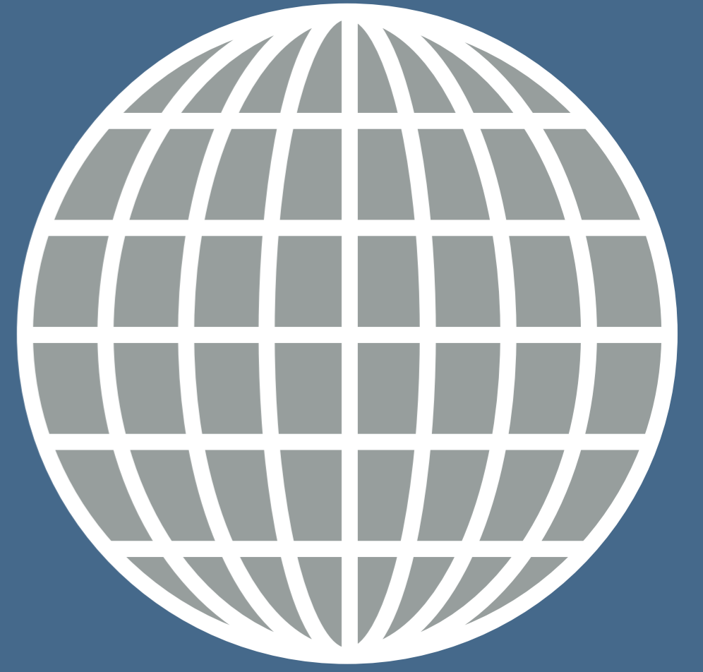
Internationales 9,6 %