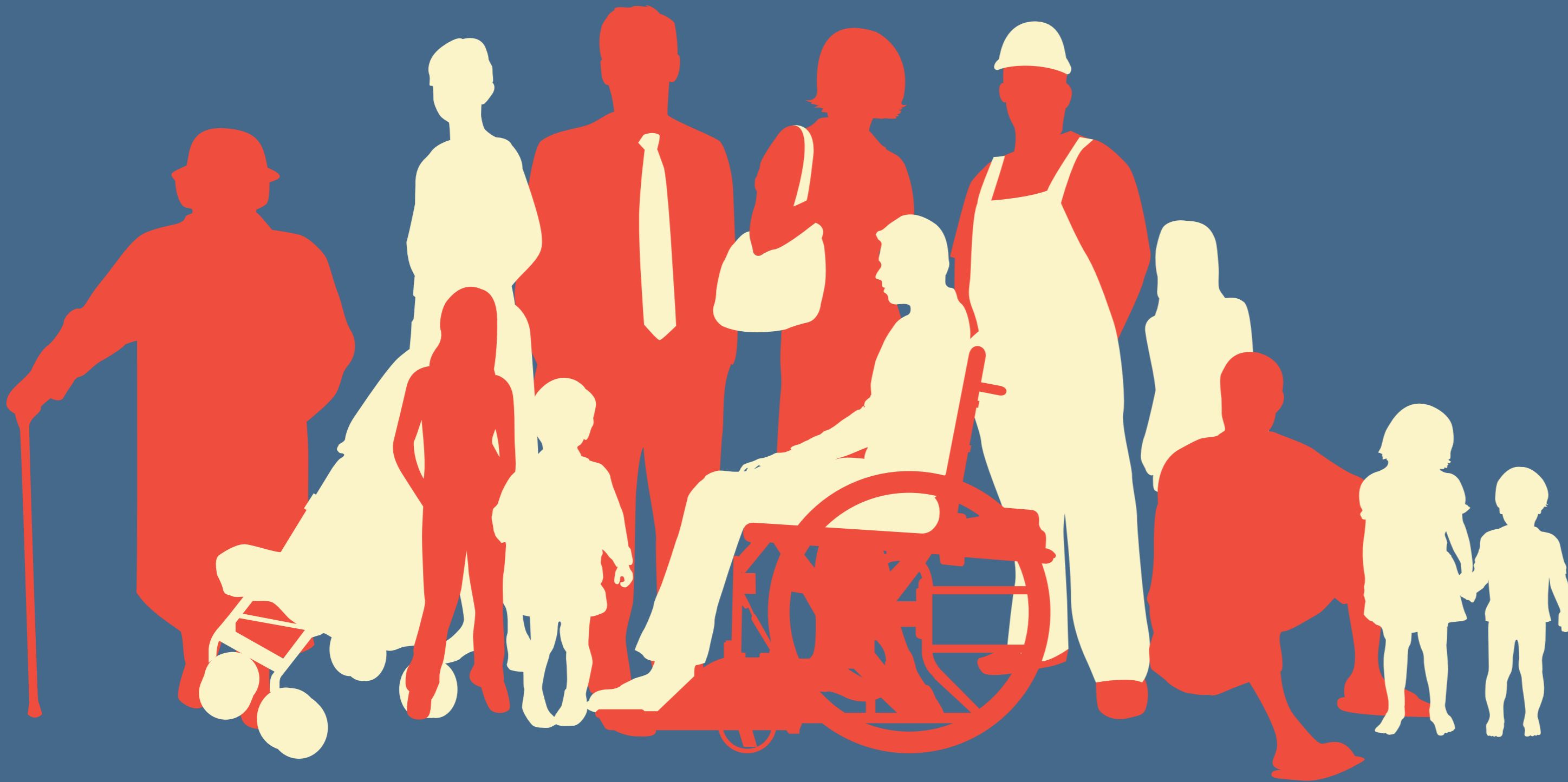
Gesellschaft 52,3 %